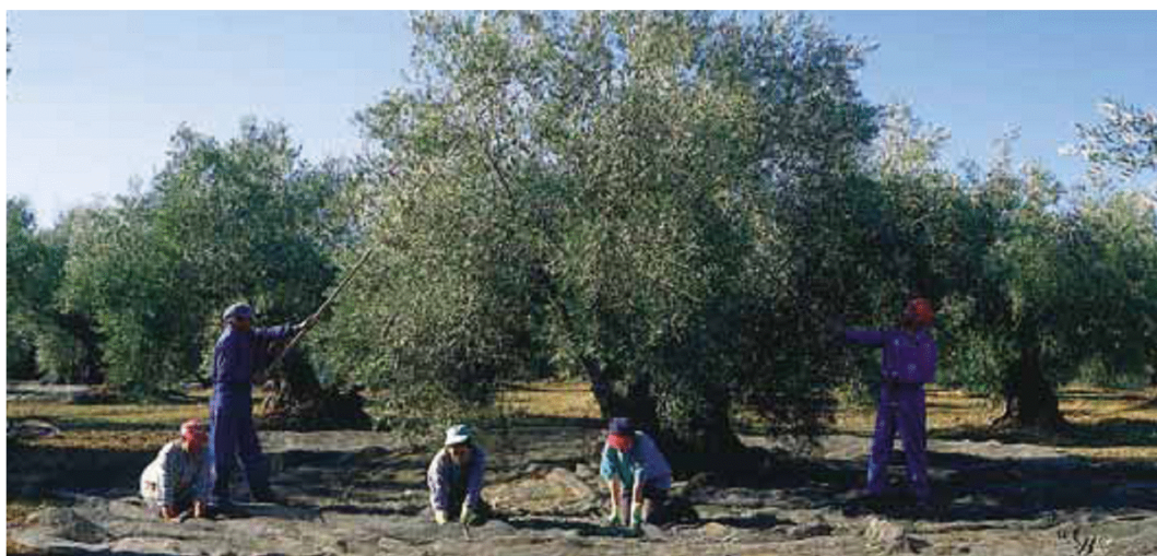
Сезон сбора урожая в оливковых рощах компании MKOLIVECO

Компания MKOLIVECO была основана в 2001 году. Основные ресурсы завода находятся рядом с парком Natural Park в регионах Суббетика и областью Пониенте де Гранада, между югом провинции Кордоба, западом провинции Гранада и югом провинции Хаен. Это место - перекресток тысячелетних культур, географически центр плодородной земли Андалусия. Этот южный район Испании является сердцем самого большого региона по производству оливкового масла в Средиземноморье и мире.