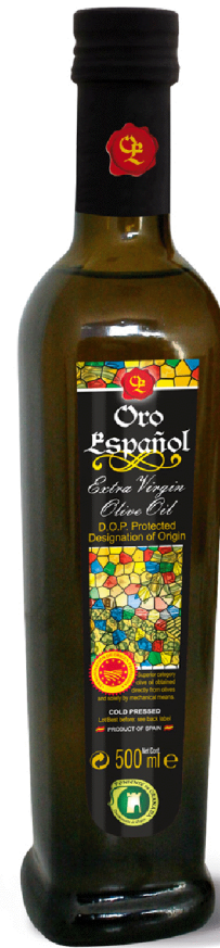
Рисунок на этикетке имеет определенное значение – часть ландшафта региона Пониенте де Гранада. Пониенте значит западная часть. А различные цвета мозаики обозначают различные виды масла, производимые на маслозаводе Oro Español.

Синий для Арбекины, желтый для Охибланки, зеленый для Пикуды и красный для Пикуаль. Ландшафт – типичный горный регион с оливковыми фермами. Эксперты утверждают, что лучшие масла – это масла, происходящие из горных регионов, где зимой холодно, благодаря чему у плода оливы особенный аромат и вкус.