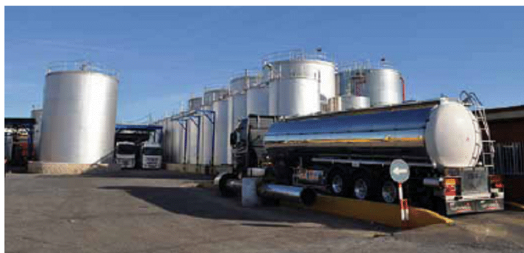
Завод по производству рафинированного оливкового масла

Компания MKOLIVECO является владельцем собственных оливковых рощ и маслозаводов, благодаря чему производство является бесперебойным, а контроль качества и безопасности продукции обеспечивает неизменно превосходные органолептические и химические показатели продукции.