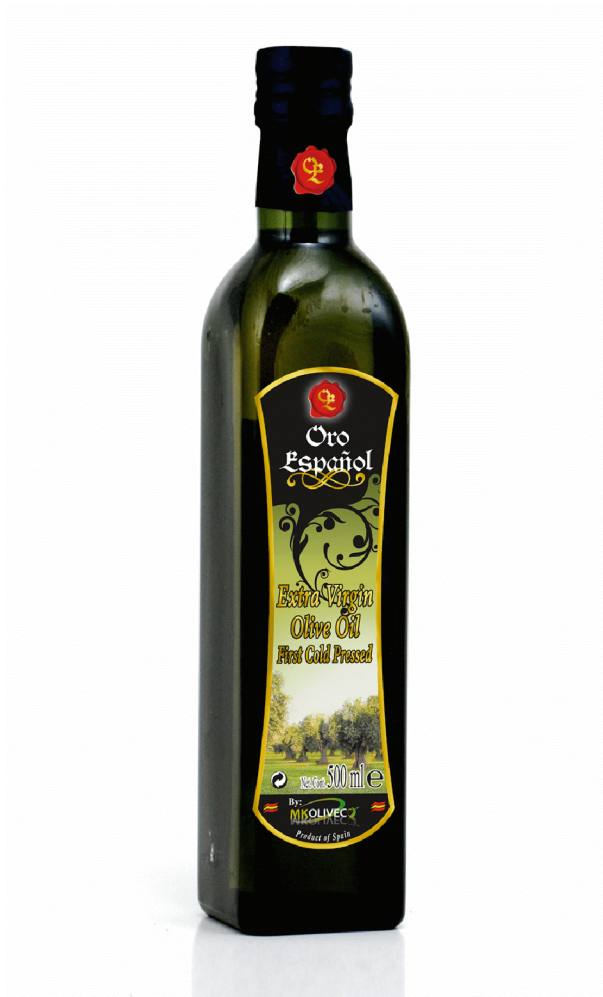
Бутылка Dorica 250мл, 500мл, 750мл